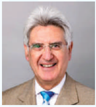
Rtn. Francesco Arezzo RI President 2025-26